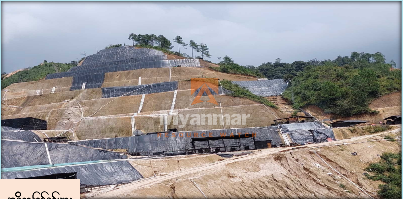
အဓိကဖြစ်စဉ်များ

ကိုင်တပ်ဖွဲ့ KIA ကို ၁၉၆၁ ခုနှစ်တွင် တည်ထောင်ခဲ့သည်။ ဤကာလတွင် KIA သည် ကချင်ပြည်နယ်တွင် စစ်အစိုးရ ဆန့်ကျင်ရေးလှုပ်ရှားမှုများ ဆောင်ရွက်ခဲ့ပြီး သယံဇာတ ထိန်းချုပ်မှုကို စိန်ခေါ်ခဲ့သည်။ ထိုအချိန်က မြေရှားသတ္တု တူးဖော်မှုသည် အကြီးစားတူးဖော်ထုတ်လုပ်မှု မဟုတ်သော်လည်း KIA ၏ ထိန်းချုပ်နယ်မြေများတွင် သဘာဝသယံဇာတများကို ထုတ်လုပ်အသုံးချခဲ့ကြသည်။